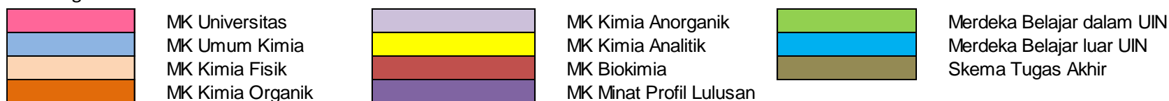
Gambar 2. 1 Peta kurikulum PS Kimia berdasarkan inti keilmuan kimia, profil lulusan, dan kampus merdeka